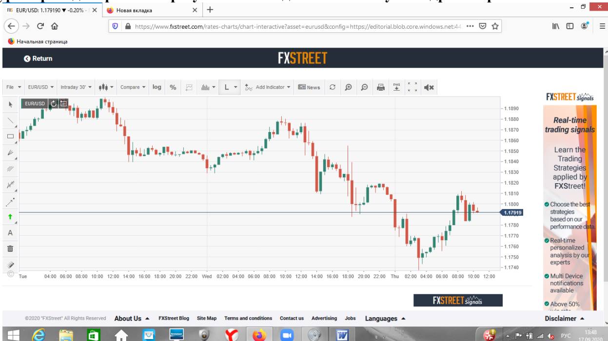
Рис. 3 ПОВЕРТАЮЧИСЬ ДО МІСЦЕВОГО РИНКУ АКЦІЙ

Розмірений рух індексу Української біржі вверх-вниз у вузькому діапазоні, який спостерігався в минулі кілька місяців в останні дні порушився. Світові фондові індекси теж стали зараз менш передбачуваними. Тож сьогодні на початку дня можна було з приблизно рівною ймовірністю очікувати росту та зниження індексу Української біржі.